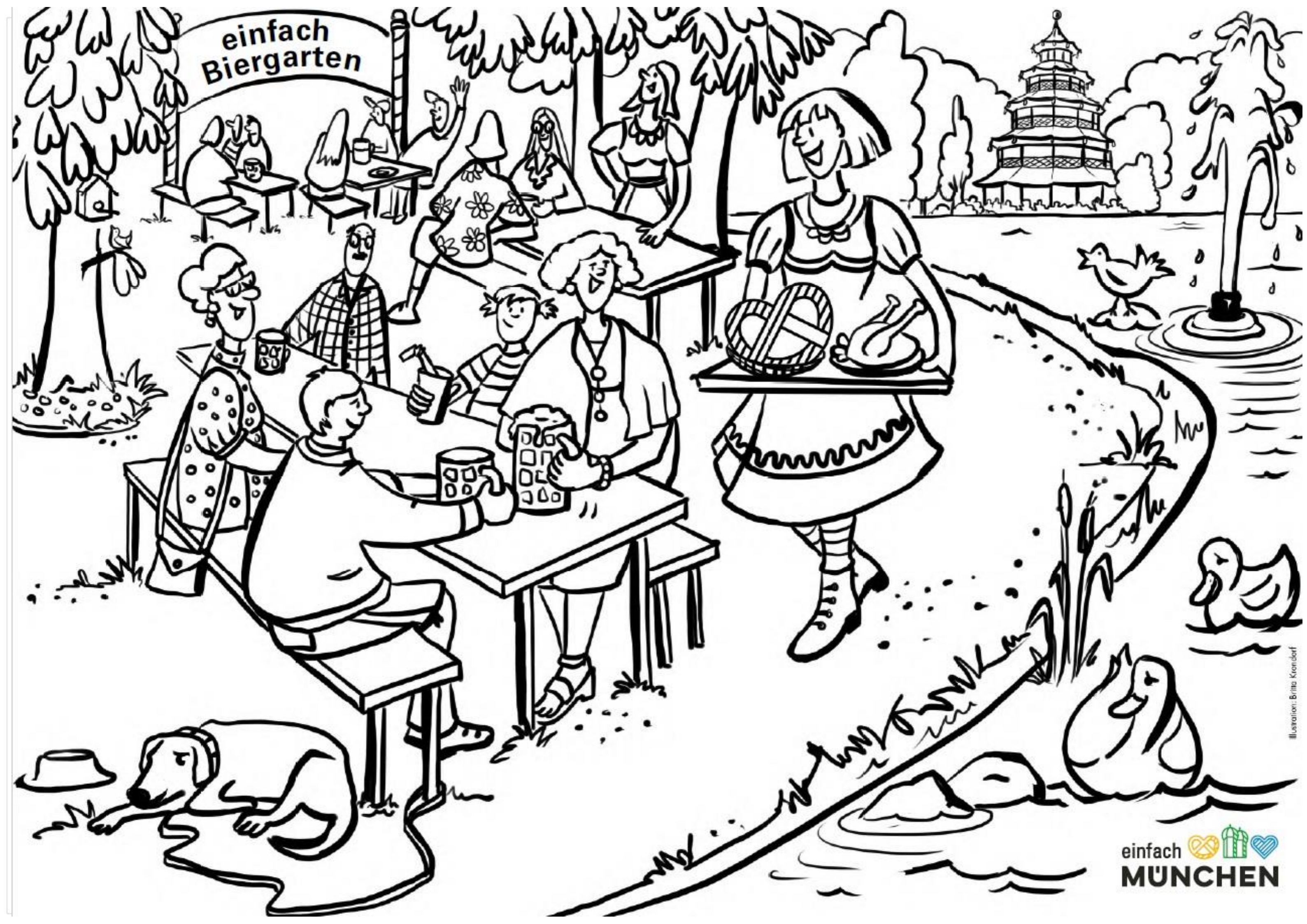
Illustration: Britta Kronsdorf